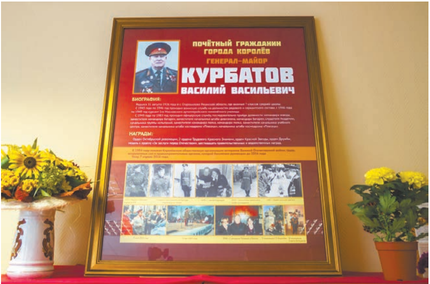
Памятный стенд открыли в помещении Совета ветеранов

Дмитрий Орлов, фото автора и пресс-службы администрации г. Королёва