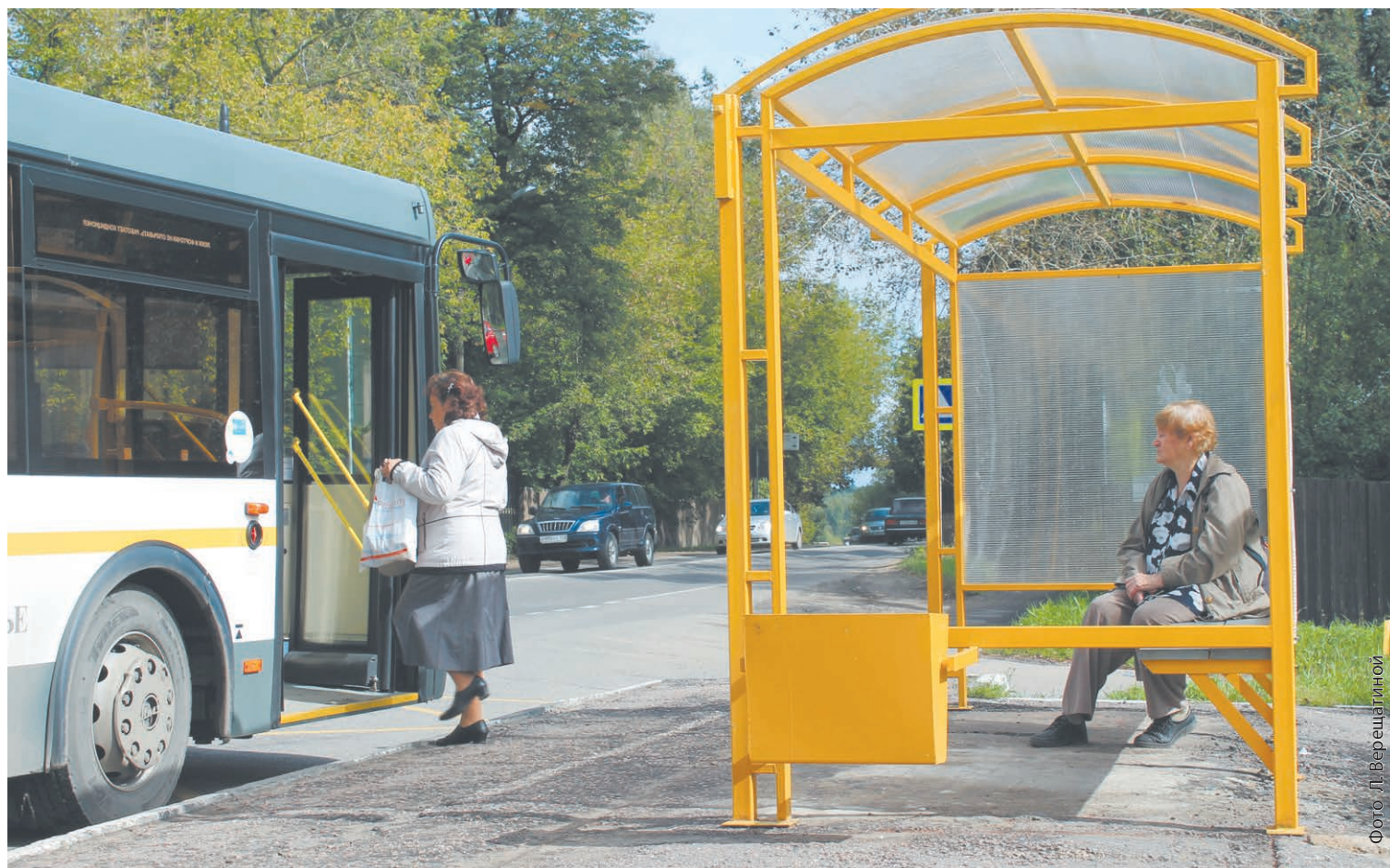
Современные остановочные павильоны на улице Станционной

ПО ПОРУЧЕНИЮ ГУБЕРНАТОРА В КОРОЛЁВЕ ПОЯВИЛИСЬ НОВЫЕ ОСТАНОВОЧНЫЕ ПАВИЛЬОНЫ. НАПОМИНИМ, ЧТО НА ВСТРЕЧЕ С АНДРЕЕМ ВОРОБЬЕВЫМ, КОТОРАЯ ПРОШЛА В ГОРОДЕ 26 АВГУСТА, ЖИТЕЛИ НАУКОГРАДА ОБРАТИЛИСЬ К ГУБЕРНАТОРУ И РУКОВОДСТВУ ГОРОДА С ПРОСЬБОЙ УСТАНОВИТЬ НОВЫЕ ПАВИЛЬОНЫ АВТОБУСНЫХ ОСТАНОВОК В МИКРОРАЙОНАХ БОЛШЕВО И ПЕРВОМАЙСКИЙ.