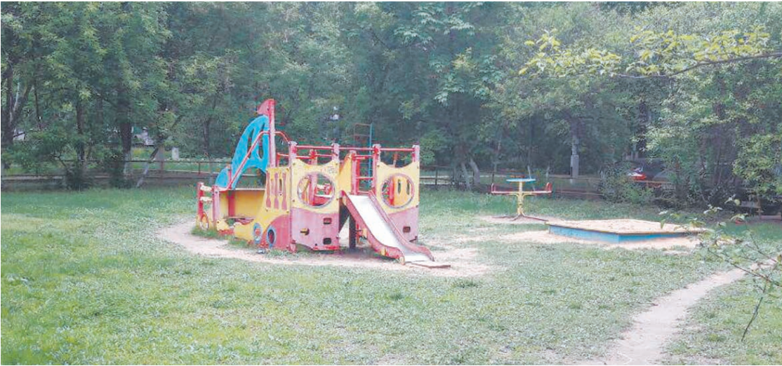
Такой была площадка во дворе по ул. Сакко и Ванцетти...

Власти Королёва не только выполнили все требования губернатора, но и проявили похвальную инициативу: на детских площадках наукограда устанавливают системы видеонаблюдения, укладывают новый асфальт на тротуарах во дворах и подходах к подъездам, а также обновляют отмостки домов. Впрочем, не лишне обратиться к сухим цифрам: в течение 2016 года в ходе благоустройства придомовых территорий в Королёве будет не только установлен 31 детский игровой комплекс, но и высажено 265 деревьев и 1135 кустарников. Во дворах появится не менее 1600 допол-