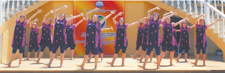
Ансамбль «Фантазия» – лауреат хореографических конкурсов

19 лет в микрорайоне Юбилейный работает муниципальное бюджетное учреждение дополнительного образования «Школа искусств», которое пользуется у горожан огромной популярностью. В Школе искусств работают семь отделений художественной и социально-педагогической направленности. Запись на учёбу на театральное, хореографическое, художественное отделение, а также журналистики и иностранных языков начинается задолго до Дня знаний. Дети принимаются сюда с 5 лет, и их таланты сразу же начинают раскрываться. Так, детский хореографический ансамбль «Фантазия» этим летом завоевал Гран-при на конкурсе-фестивале «Будущее планеты», который прошёл в Туапсе, а юные художники были отмечены хрустальным призом за участие в XV международном пленэре на владимиро-суздальской земле. Каждый год вы-