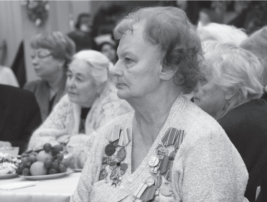
В школе № 13 по многолетней традиции собираются ветераны-блокадники