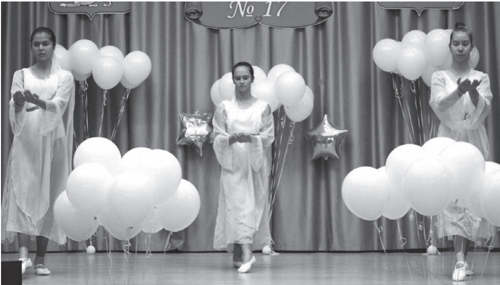
Символический танец в память о детях Беслана