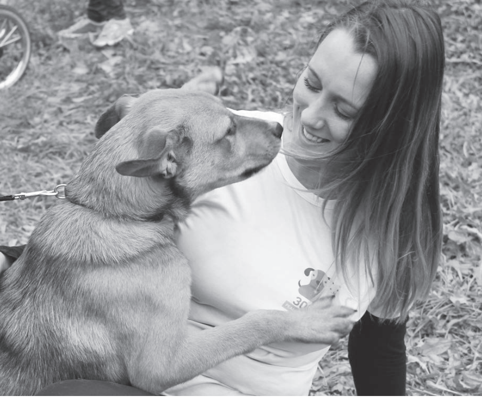
Четверолапый друг хочет тепла

4 сентября в центре проходила акция под названием «Подари тепло». Вообще этот реабилитационный центр существовал как частный с 2013 года – на средства основателя и пожертвования неравнодушных людей. На данный момент центр заполнен животными – около 130 собак и более 20 кошек нашли себе здесь временное пристанище. Но волонтеры влюблены в каждого питомца и уверены, что обязательно скоро найдутся те, кто скажет: «Этот пёсик ждал именно меня!» Девиз команды, делающей доброе дело, говорит за себя сам с каждой футболки волонтеров: «Мы помогаем людям и животным найти друг друга!» Уже в четвёртый или пятый раз в этом году центр открывает двери и приглашает к знакомству и сотрудничеству неравнодушных сердец людей. Рыжий 6-месячный Граф, смоляной Макс и особенная собака Марго, у которой всего три лапы, встречали гостей по адресу: проспект Космонавтов, 40а. А ещё 6 очаровательных щенят и великолепные коты, кошечки и котят – малая толика тех, что сейчас проживают в «300 ДОМЕ». Поделиться с собаками и кошками теплом сердец, подобрать себе хвостатого