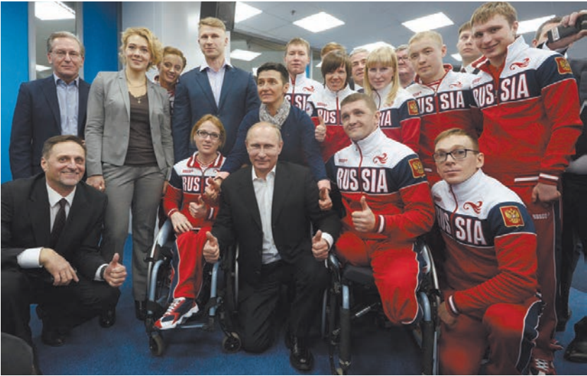
Президент Владимир Путин с паралимпийцами

7 СЕНТЯБРЯ В МОСКОВСКОЙ ОБЛАСТИ СТАРТОВАЛА ПАРАЛИМПИАДА ДЛЯ РОССИЙСКИХ СПОРТСМЕНОВ, НЕ ДОПУЩЕННЫХ К УЧАСТИЮ В ОЛИМПИАДЕ В РИО-ДЕ-ЖАНЕЙРО.