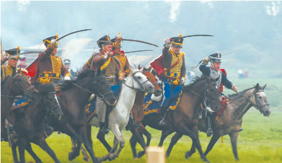
Фрагмент реконструкции сражения

Открылся фестиваль в д. Шевардино торжественным мероприятием у монумента «Мёртвым Великой армии». Далее у