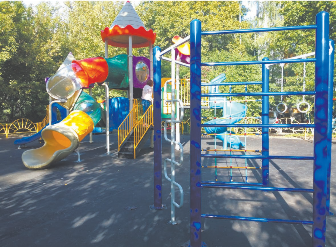
... и такой стала

нительных парковочных мест. Кроме того, оборудуют 31 контейнерную площадку, установят 158 опор освещения и заменят на новые 245 светильников. Во дворах появится 31 информационный щит, что в преддверии выборов немаловажно. Людям необходима информация. Так что, цифры хоть и сухие, но за наша жизнь, человеческие судьбы.