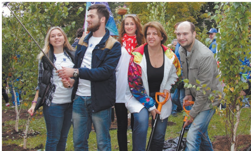
В прошлом году акция «Наш лес. Посади своё дерево» совпала с празднованием Дня города