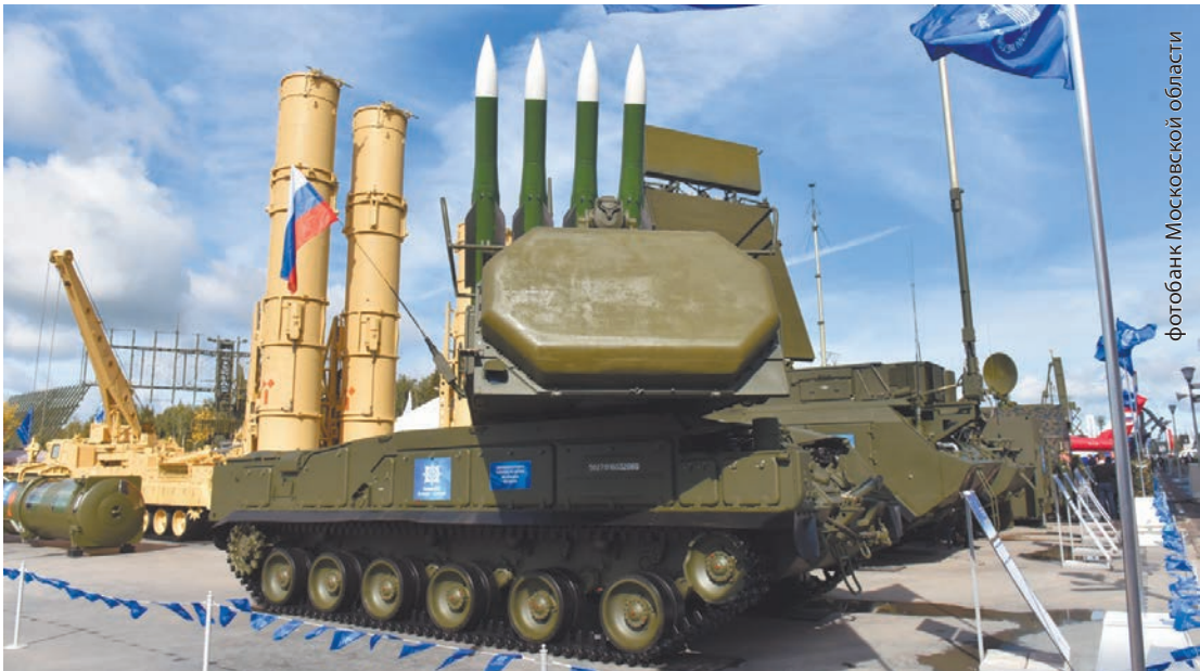
Экспонаты, представленные на форуме

В КОНГРЕССНО-ВЫСТАВОЧНОМ ЦЕНТРЕ ПОДМОСКОВНОГО ВОЕННО-ПАТРИОТИЧЕСКОГО ПАРКА КУЛЬТУРЫ И ОТДЫХА ВООРУЖЁННЫХ СИЛ РФ «ПАТРИОТ» В ПОДМОСКОВНОЙ КУБИНКЕ 6 СЕНТЯБРЯ ОТКРЫЛСЯ II МЕЖДУНАРОДНЫЙ ВОЕННО-ТЕХНИЧЕСКИЙ ФОРУМ «АРМИЯ-2016». В ЕГО РАБОТЕ ПРИНЯЛ УЧАСТИЕ ГУБЕРНАТОР МОСКОВСКОЙ ОБЛАСТИ АНДРЕЙ ВОРОБЬЕВ.