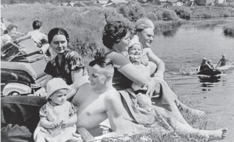
Первый космонавт во время отдыха с семьёй на Клязьме

в «Гагаринский пляж». И тем самым, в год 55-летия первого полёта в космос, увековечили память о великом космическом подвиге в таких земных понятиях, как пляж!